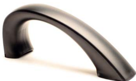
Mango de electrodoméstico (molde 0.5T). Industria electroméctica.

El deseo de seguir evolucionando, junto con la inversión en nuevas tecnologías y con las pruebas demostradas al largo de su trayecto, hace de PMPM una empresa sólida y preparada para afrontar nuevos desafíos.