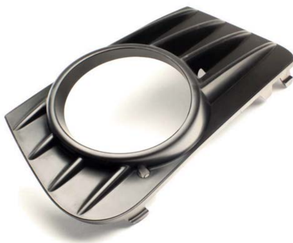
Rejilla de luces antiniebla (modelo 1.5T). Industria automóvil.